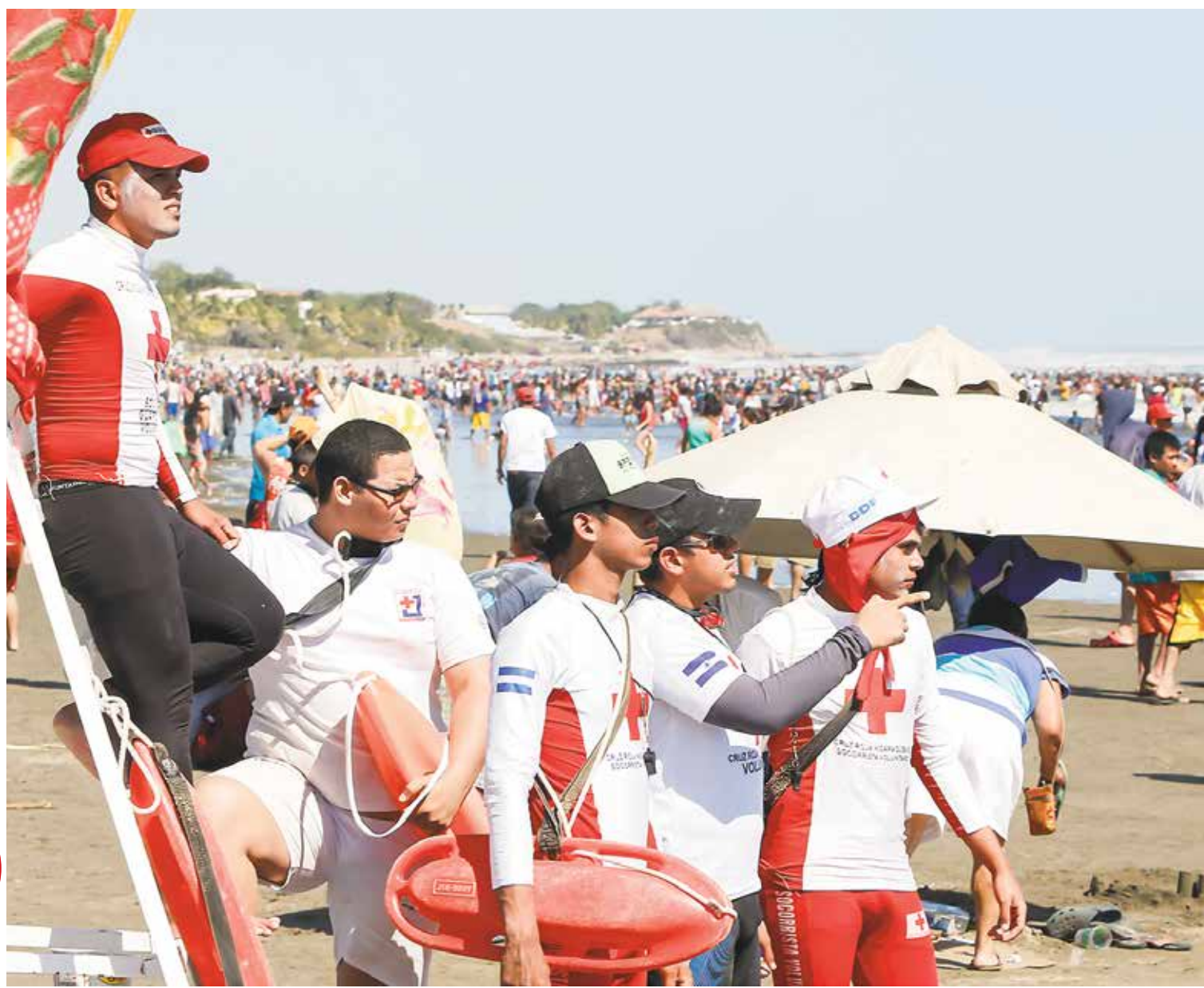
SALVAVIDAS EN LA COSTA DE POCHOMIL.

Informes oficiales preliminares registran 17 muertes por sumersión y 23 por accidentes de tránsito entre el 8 de abril y la tarde de ayer. En la Semana Santa de 2016 hubo 51 decesos por las dos causas. Las autoridades también reportan 6 homicidios en este período de 2017. PAÍS PÁG. 3A Y PÁG. 6A