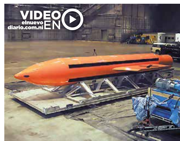
LA BOMBA GBU-43 MOAB FUE LANZADA EN AFGANISTÁN.

ATAQUES. Recientes ataques contra Afganistán y Siria, pero también la retórica endurecida contra Corea del Norte son mensajes contundentes de la política internacional de la era Trump. GLOBO PÁG. 6B