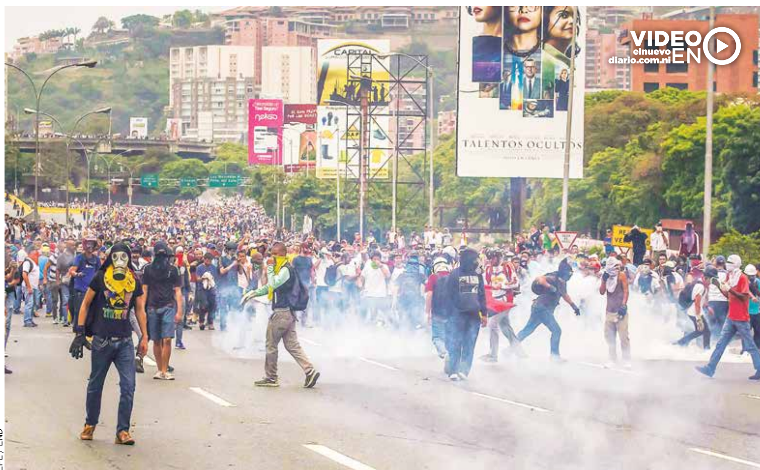
EFE / END