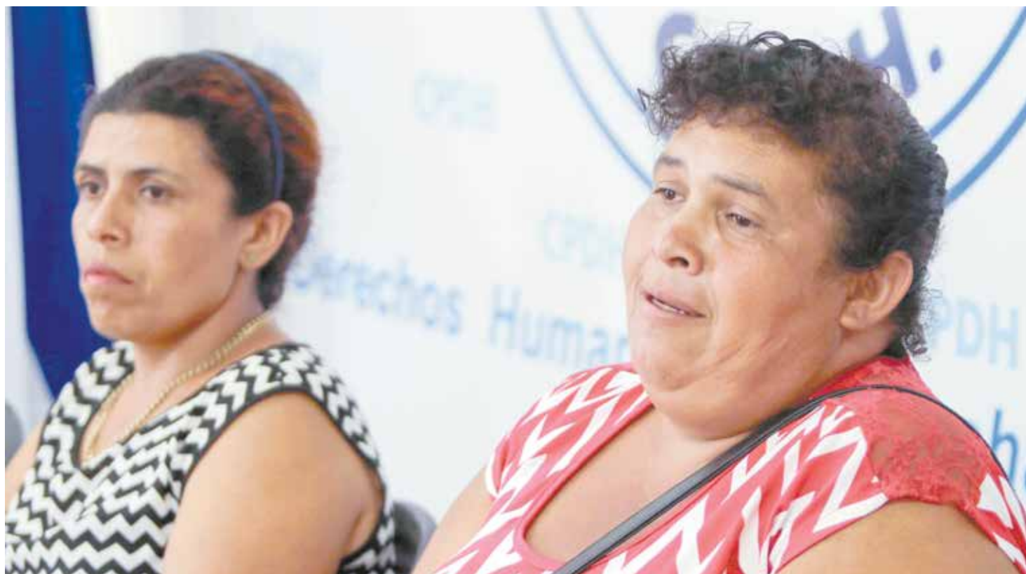
LOS FAMILIARES DEL JOVEN, SUPUESTAMENTE CASTRADO EN JINOTEGA, AFIRMAN QUE HAN SIDO AMENAZADOS DESPUÉS DE DENUNCIAR EL HECHO.

Informó que en una asamblea realizada el martes con más de 50 líderes, la Alianza Cívica se planteó como meta integrar a más movimientos y actores en resistencia pacífica que estén comprometidos con la instauración de una democracia. PAÍS PÁG. 8A